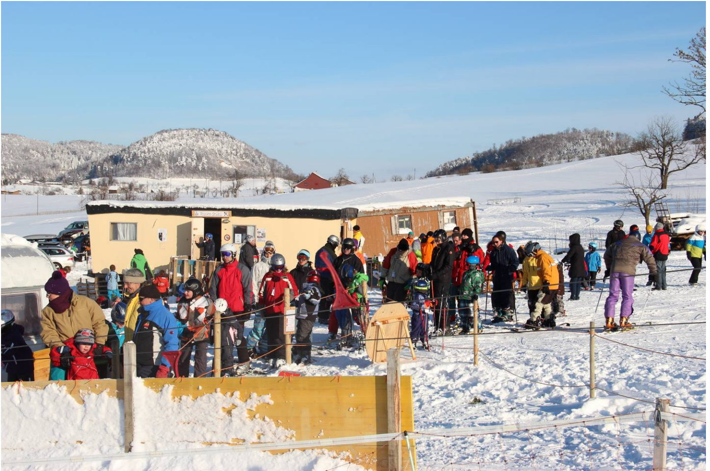
Wintertag beim Skilift