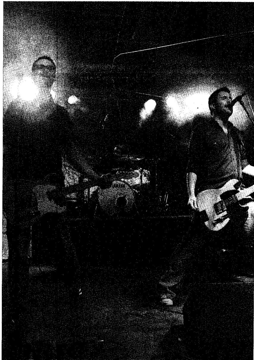
Ihr Konzert gehörte zu den absoluten Höhepunkten des Openairs: «Favez» aus Lausanne.