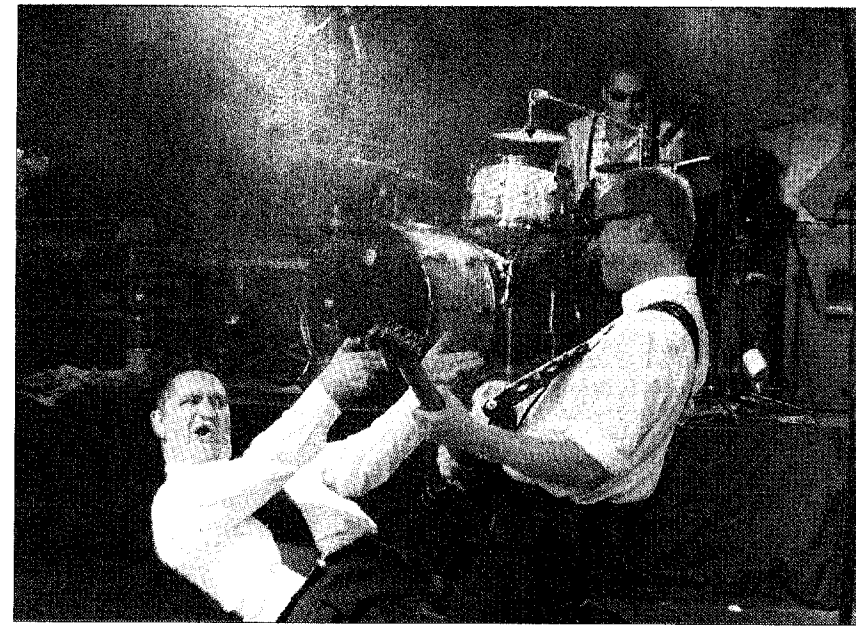
Die Gruppe «Shooters» rief die «Götter des Rock'n'Roll».