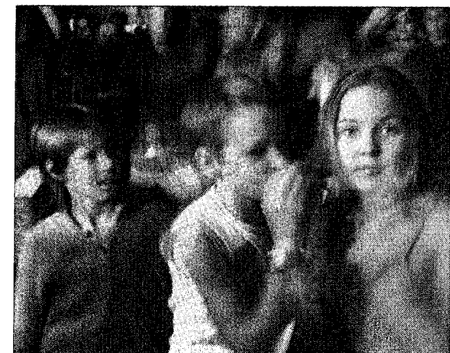
Keiner zu klein, ein Openair-Fan zu sein: Die Jüngeren waren meist in den vordersten Reihen anzutreffen