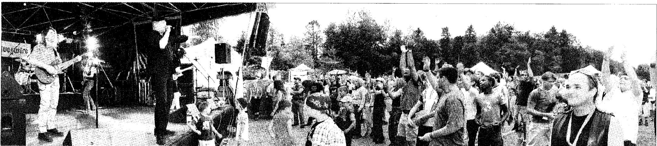
«Live Wire» lockte mit jaulenden Gitarrenriffs, rockigen Rhythmen und heissem Gesang zahlreiche Musikfans zum Tanzen und Mitklatschen vor die Bühne.