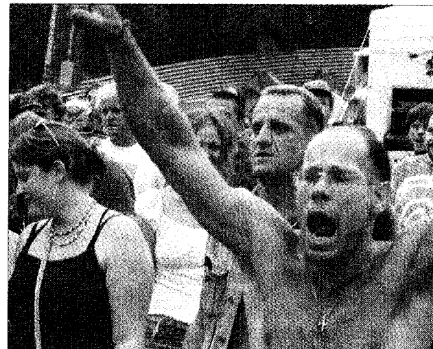
Die Zuschauer machten es den Rockstars auf der Bühne nach und schrien und sangen mitunter lauter als der Leadsänger.