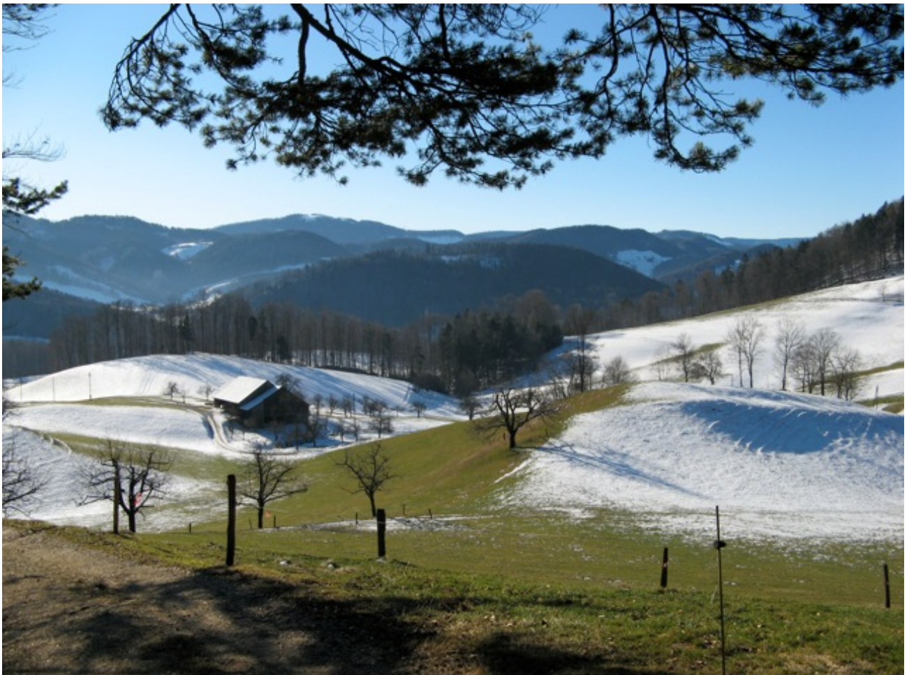
Hof Gründen in der Engi